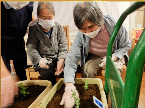
来年の4月ごろ収穫