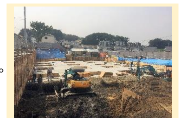
しょうじゅの里三保サテライト型施設 建設工事中

この他にも構想中のプランがいくつかあり、本部には早くも開設を望む多くの声が届いています。