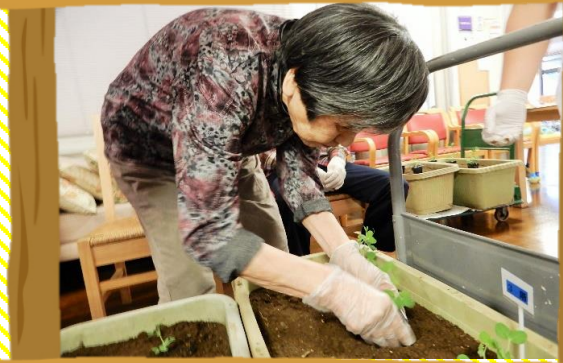
種から育てて苗をプランターに移植