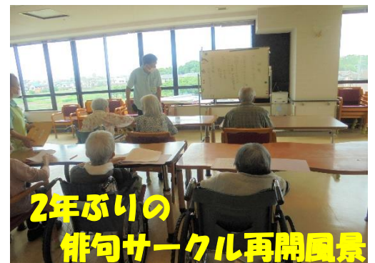
2年ぶりの俳句サークル再開風景