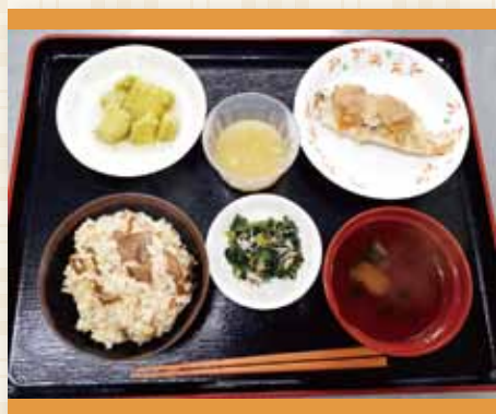
ハロウィンランチ