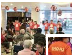
▲ 去年の様子 ▶