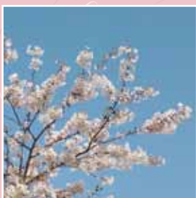
▲ 施設近隣で見られる桜の風景。