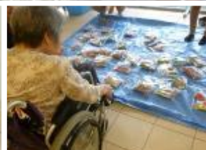
釣り上げたヨーヨーや輪投げの景品は、お土産にしてお部屋へ持ち帰られました。