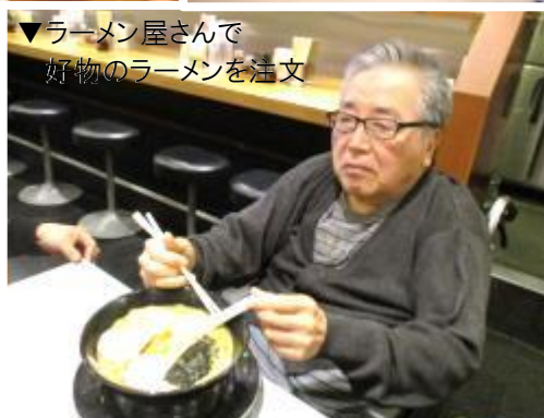
▼ラーメン屋さんで 好物のラーメンを注文