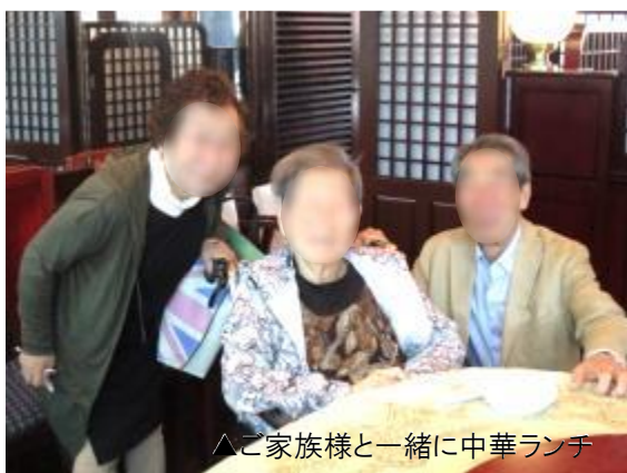
△ご家族様と一緒に中華ランチ