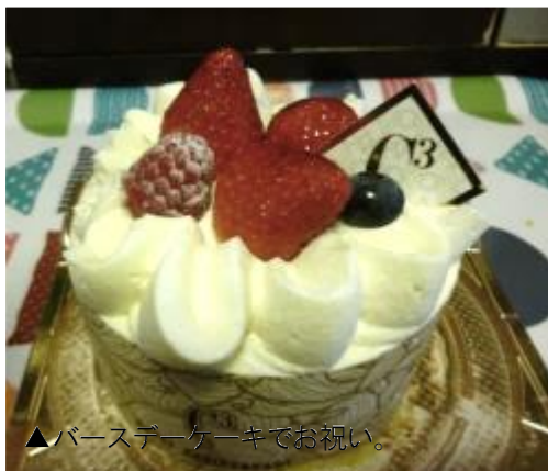
▲バースデーケーキでお祝い。