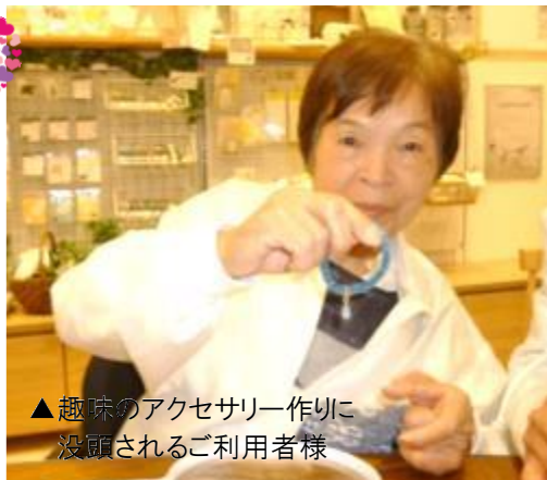
▲趣味のアクセサリ作り 没頭されるご利用者様