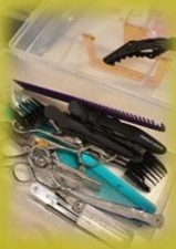
美容師さんの七つ道具。これで皆様を美しく仕上げます。