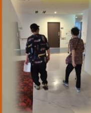
美容師さんが送迎をしてくれます。