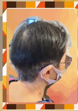
ボーイッシュなハンサムショート