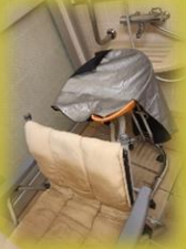
プロのシャンプーナックでうたた寝してしいそうです。