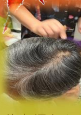
美容師さんの見事なクシさばき