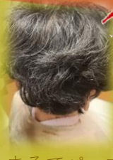
まるでパーマのような素敵なウエーブ、実は天然パーマです！