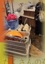
たくさん荷物を、そして立ちっぱなしの一日。本当にお疲れ様でした！