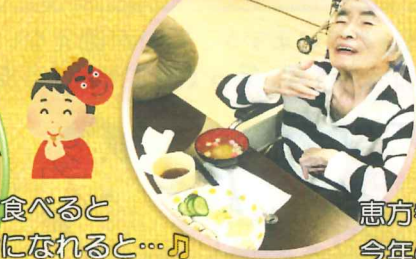
恵方巻を食べました♪ 今年の恵方は南南東♪