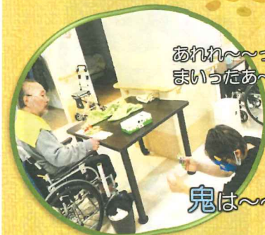
あれれ～～っ まいったあ～～××