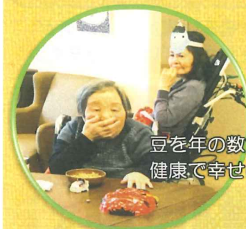
豆を年の数食べると 健康で幸せになれると…♪