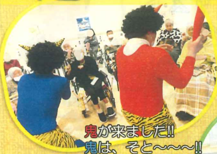
鬼が来ました!! 鬼は、そと～～!!