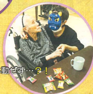
赤鬼と青鬼がやってきました!!