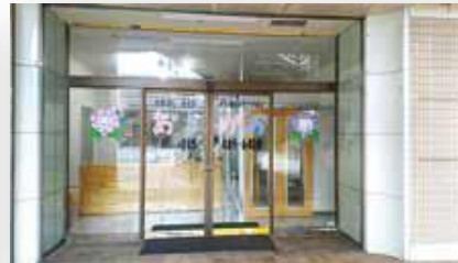
訪問看護ステーション