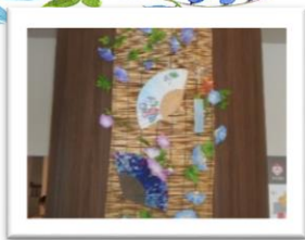
扇子・うちわで 涼しげな装飾