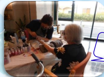
爪のケアだけでもOK