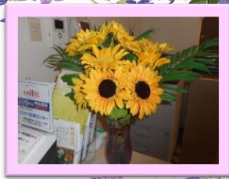
カウンター ひまわり