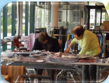
SUMMER TIME CLOUTING