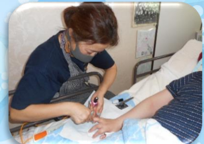
居室に伺ってネイルしました