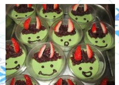
子鬼の抹茶パバロア