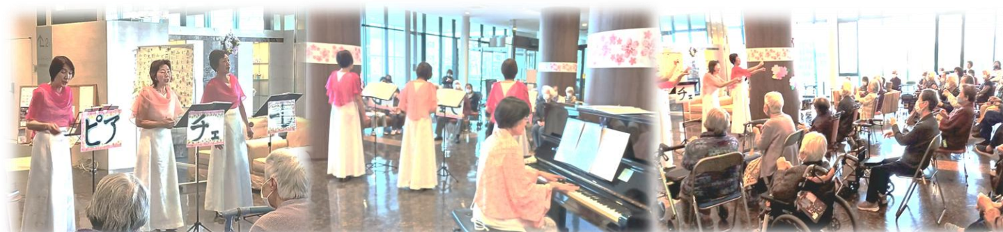
4月のレジカフェイベントは「ピアチェーレ」の方々による3人コーラスとピアノの演奏会♪ステキな歌声の演奏はもちろん、一緒に手話を使ったり、リズムに合わせて手を動かしたりと皆が参加出来る演奏会でした

この他にも過去のイベントの様子や『茶々丸』日記も公開してます♪ ブログも随時更新してますので「QRコード」か「しょうじゅレジデンス」を検索してみてください😊