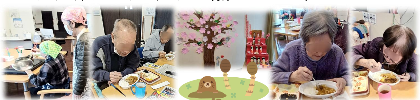
小規模多機能のデイサービスで「カレーの日」がありました♪デイサービスの利用者様2人がカレー作りをし、昼食のお弁当で出たおかずも利用したとても豪華なカレーライスでした♪