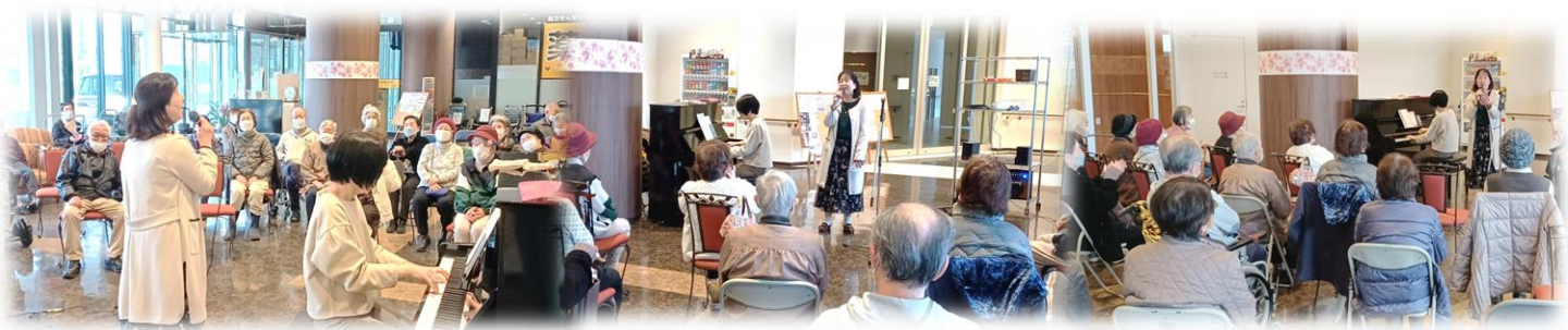
3月のレジカフェイベントは「はらこらむ」のお二人によるピアノと歌の演奏会♪途中でイントロクイズやしりとり、リクエストを入れみなさんと交流をとっていました。