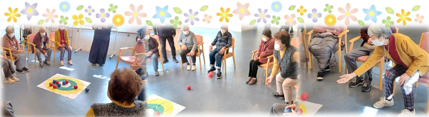
パラリンピックで有名になった『ボッチャ』！！玉が思っていたより重く、投げるだけでも良い運動になりそう…投げる事に慣れたら点数を競って対抗したら面白いかもしれませんね♪