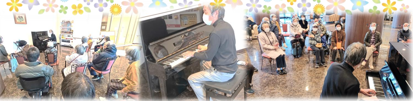
『勝手に音楽会』夕方にふらっと訪れる先生の勝手気ままな演奏会です♪先生の素敵な演奏と、みんなで歌える童謡などの合唱を時間が許す限り楽しめました。

〒261-0001 千葉県千葉市美浜区幸町2-12-1 TEL: 043-203-5065 FAX: 043-203-5160 ✉: residencr@kenaikai.com