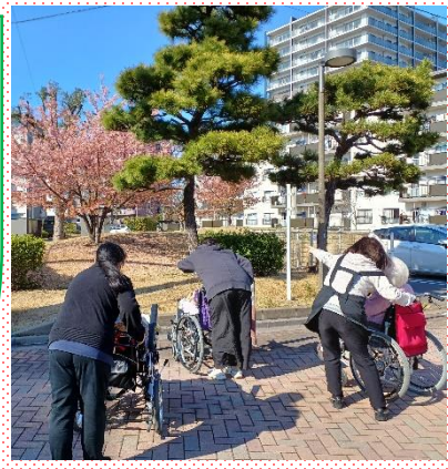
デイサービスにて

▼特養のみなさん お散歩レクの日で少し風が吹いていましたが、天気も良く、河津桜を見る事ができました。