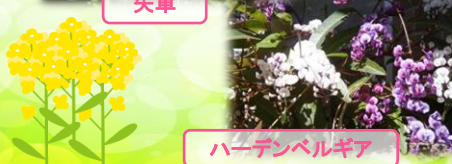
ハーデンベルギア